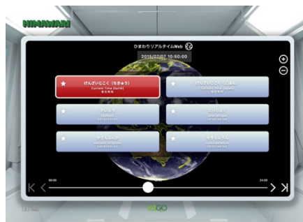
画像 2：ひまわりイベント体験ゲーム