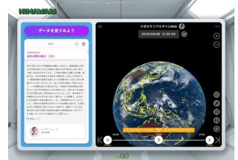
画像 3：データを見てみよう